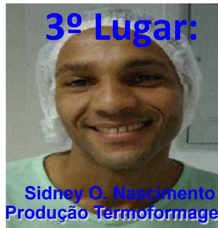
Sidney O. Nascimento Produção Termoformagem