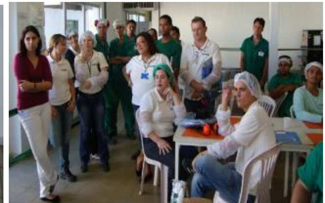
COLEGAS PRESTIGIANDO O EVENTO